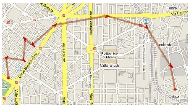
Comune tracciatura percorso a tempo

L' algoritmo di tracking posizione adottato da VIS sfrutta, oltre ai comuni criteri di spazio e tempo , anche la direzione . Se il veicolo è in movimento, il GPS fornisce anche la direzione di spostamento e pertanto un cambio di direzione è perfettamente intercettabile. Tale soluzione consente la “ ricostruzione percorso ” cioè la riproduzione dell'esatta sequenza di vie attraversate dal mezzo.