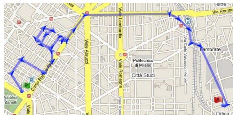
Ricostruzione percorso VIS tempo-svolta